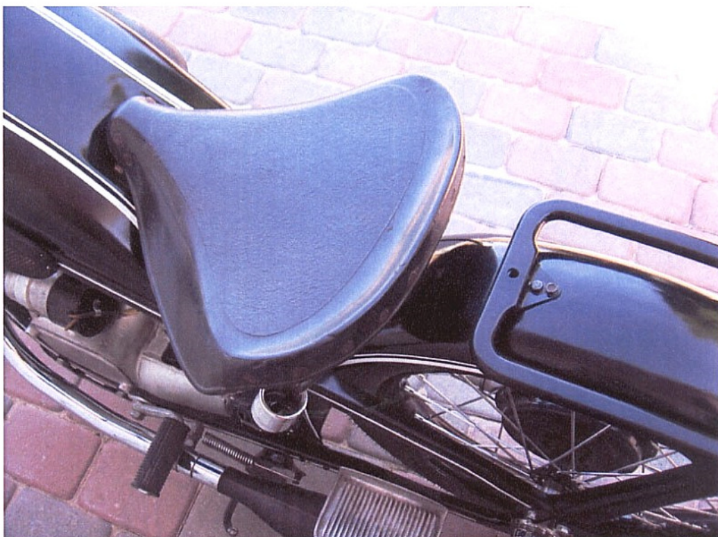
Vaade sõiduki istme(te)le