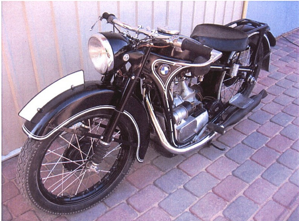
Diagonaalvaade esiosale ja vasakule küljele