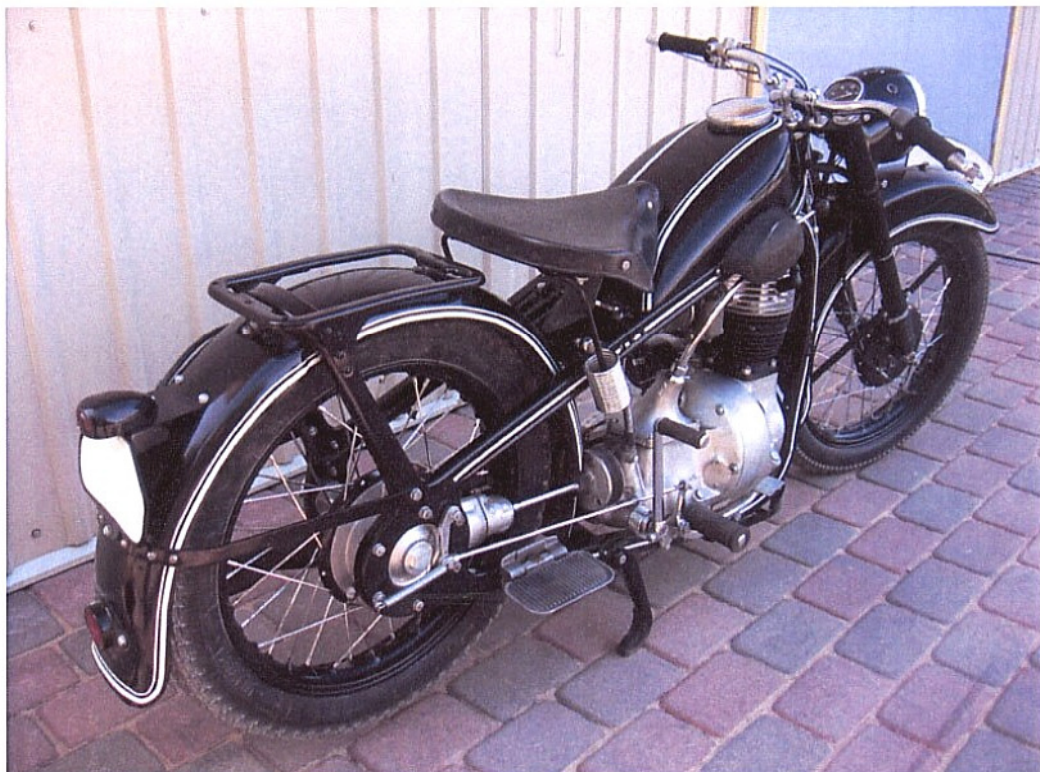
Diagonaalvaade tagaosale ja paremale küljele