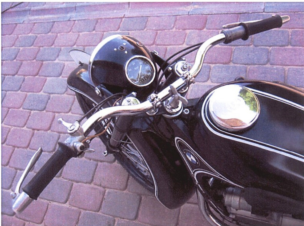
Vaade sõiduki juhtimisseadmetele